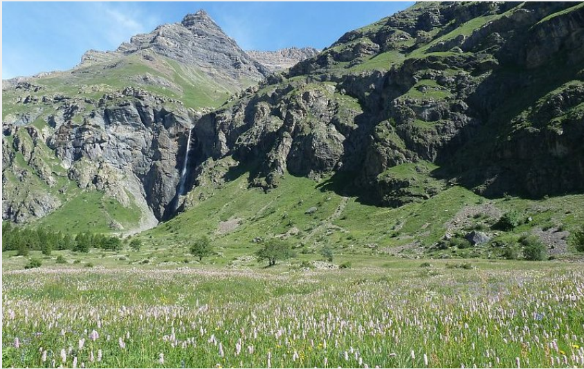
Près Baridon sur l'itinéraire du col de Freissinières (Blandine Delenatte - PNE)