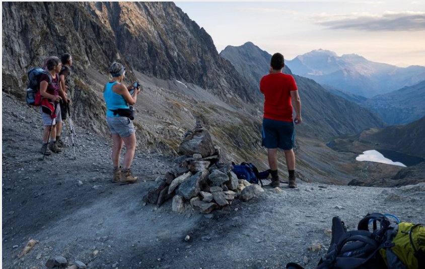
Col de la Muzelle au lever du jour