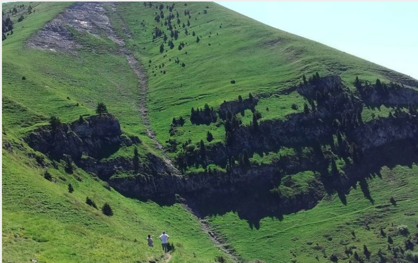
Vêt vu du Jas des Agneaux (Bernard Nicollet - PNE)