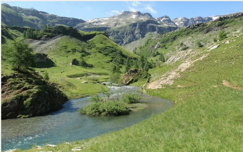
Le torrent en aval du lac du Fangeas