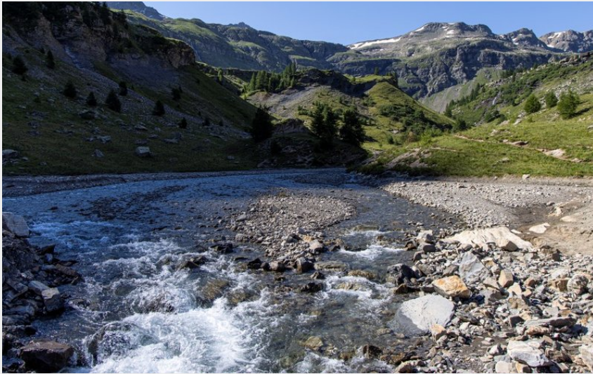
Ancien lac du Fangeas (Thierry Maillet - Parc national des Ecrins)