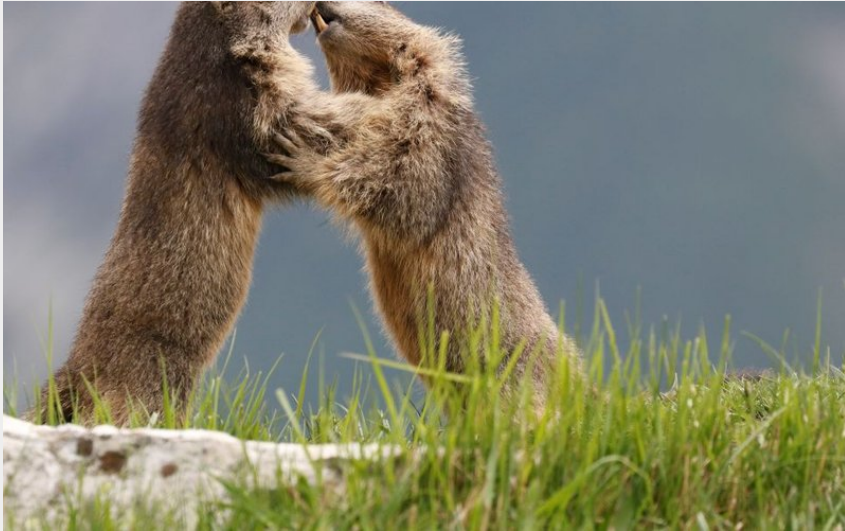
Deux marmottes