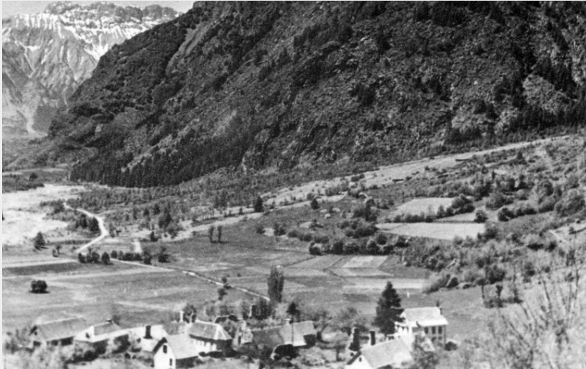
Crédit : Moline dans les années 1950 (Collection de Simon photographe)