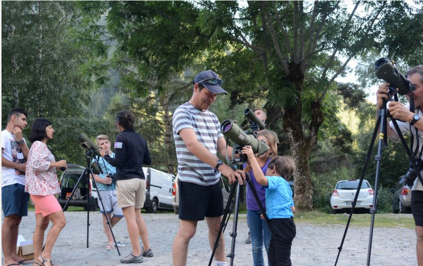
Point faune à Moline en Champsaur