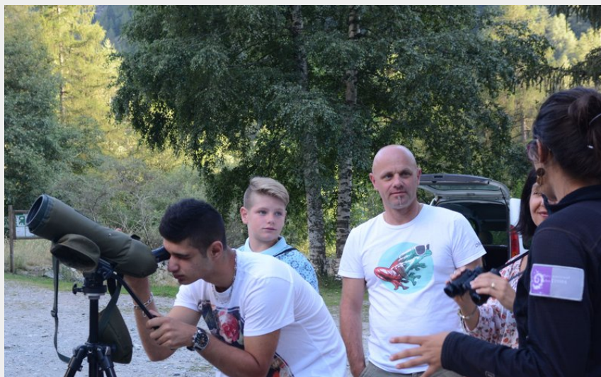
Point faune à Moline en Champsaur