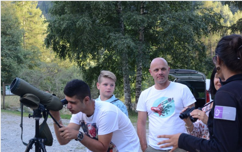
Crédit : Point faune à Moline en Champsaur (Dominique Vincent, Parc national des Ecrins)