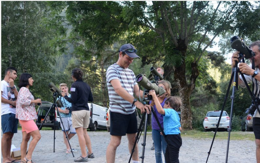
Point faune à Moline en Champsaur