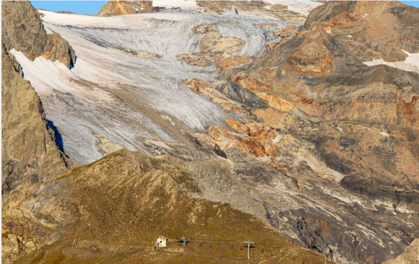
Glacier de Séguret Foran (05)