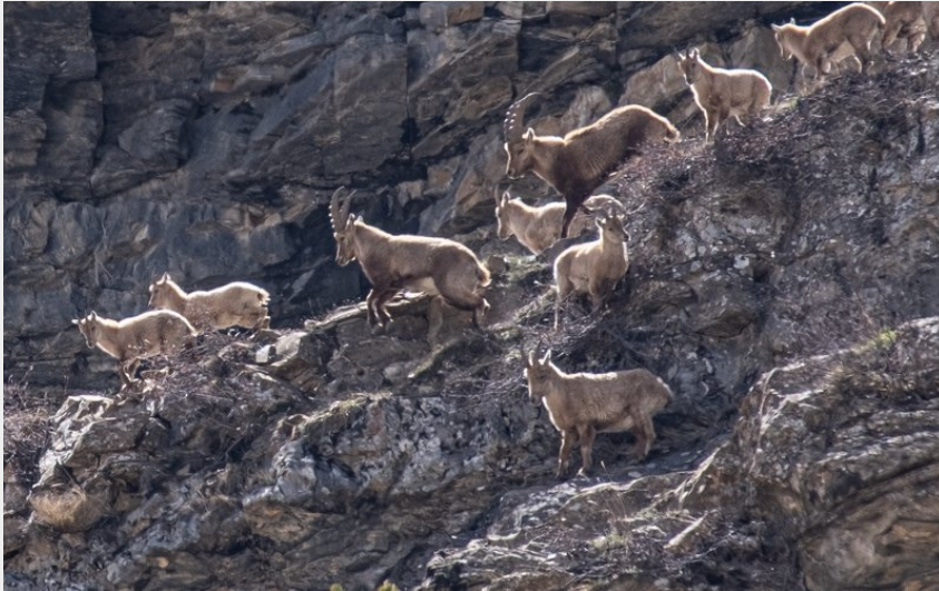
harde de bouquetins