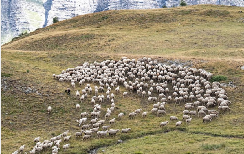
Crédit : Troupeau en alpage (Mireille Coulon, Parc national des Écrins)