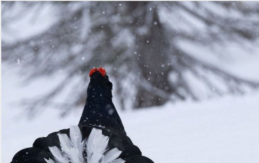
Crédit : Tetras lyre