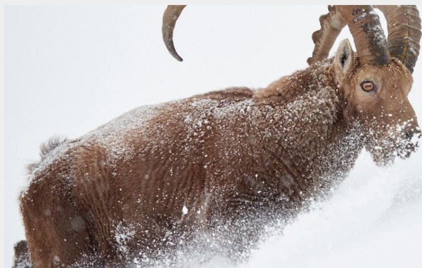
Crédit : bouquetin dans la neige