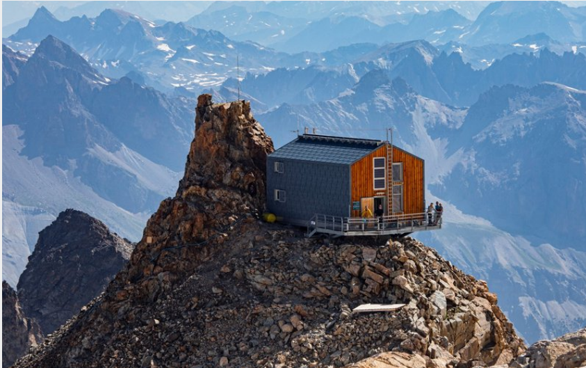
Crédit : Refuge de l'aigle (Thibaud Blais, pour le Parc national des Écrins.)