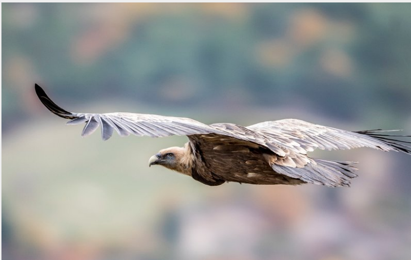
Crédit : Vautour fauve en vol (Pascal Saulay, Parc national des Écrins)