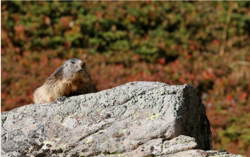
couleuvre verte et jaune