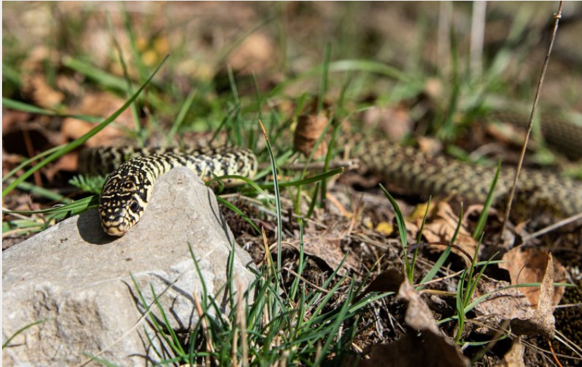
Crédit : couleuvre verte et jaune (Mireille Coulon, Parc national des Ecrins.)