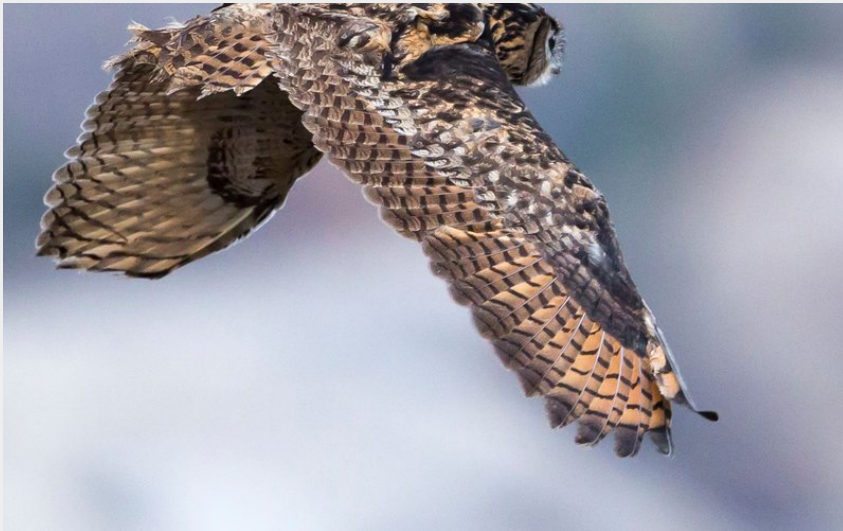
hibou grand duc