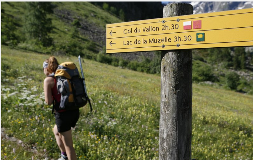
Crédit : Lac de la Muzelle (Cyril Coursier - Parc national des Écrins)