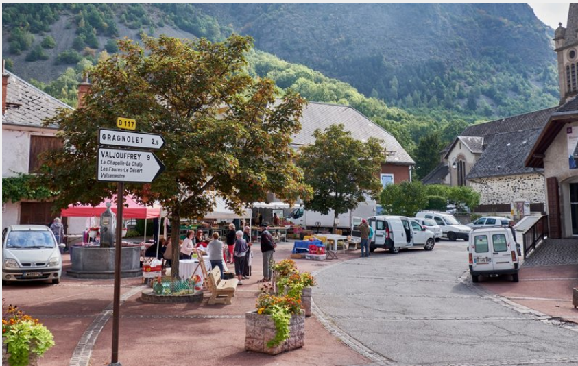
Marché local du vendredi matin à Entraigues