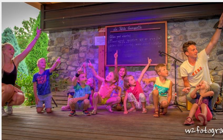
Crédit photo : Activité pour les enfants (Camping La Vieille Ferme - Embrun)