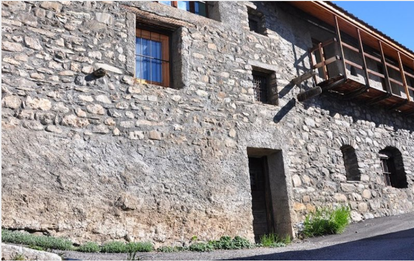
La façade - Gîte Le Dahut - Les Hières - La Grave