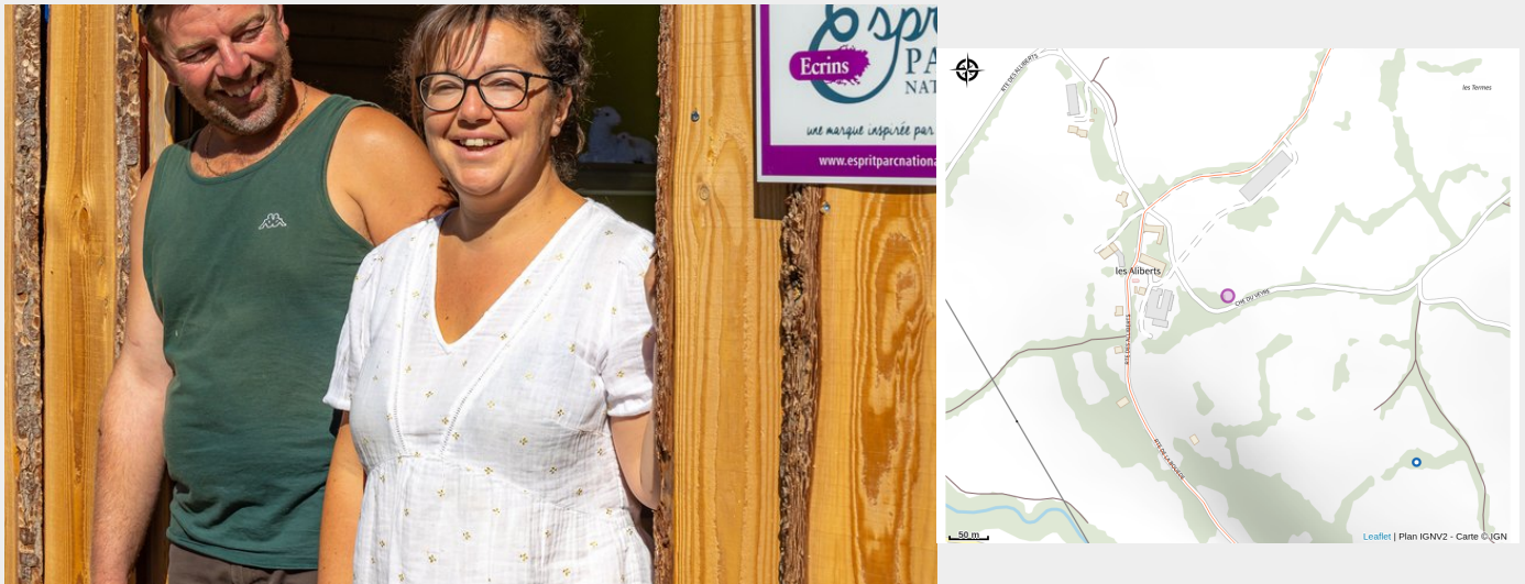
Crédit photo : © Bertrand Bodin - Parc national des Écrins (Gilles Amar - Ferme des Bichoux)