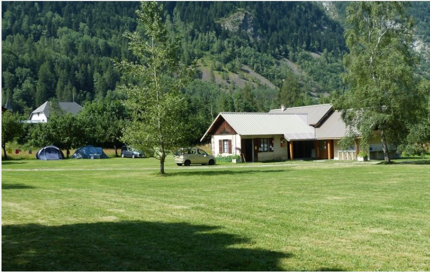
Crédit photo : Camping Les Marines, La Chapelle-en-Valgaudemar (H. Homor)