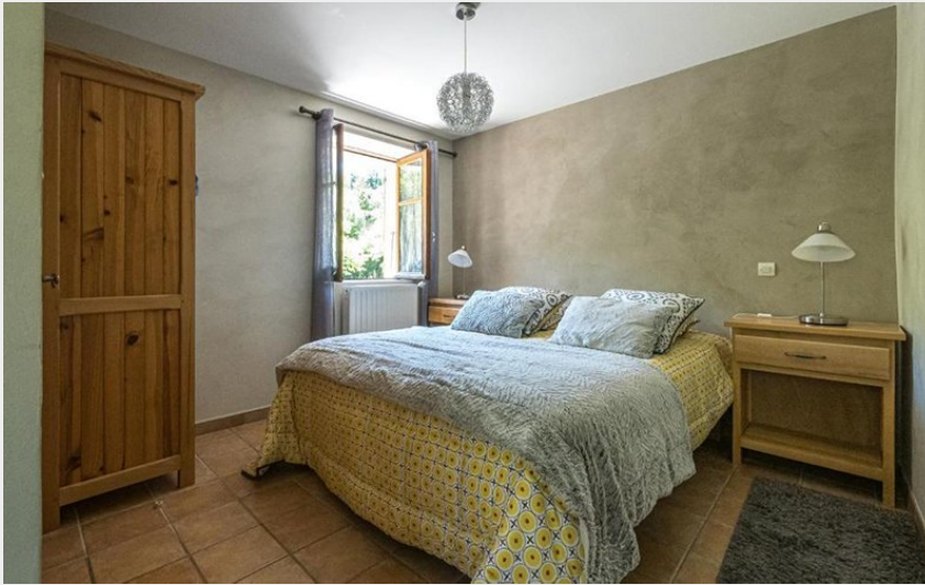
Crédit photo : Chambre d'hôtes Chez Tourache à St Jacques en Valgaudemar (BARBAN Sandra)