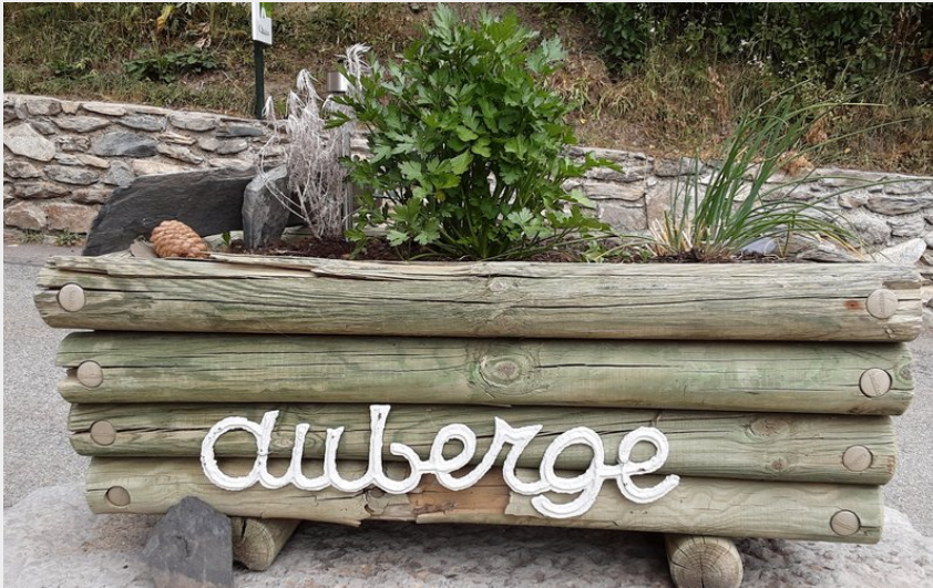
Crédit photo : pot de fleur gîte eau blanche (gîte de l'eau blanche)