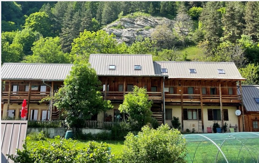
Crédit photo : Été - Le Gîte des 3 Cols RÉALLON (Le Gîte des 3 Cols)