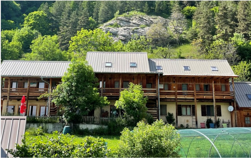
Crédit photo : Été - Le Gîte des 3 Cols RÉALLON (Le Gîte des 3 Cols)