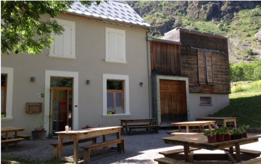
Vue du gîte extérieure, entrée et terrasse