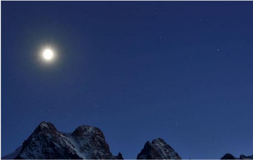
(Les Ecrins au coeur de la nuit)