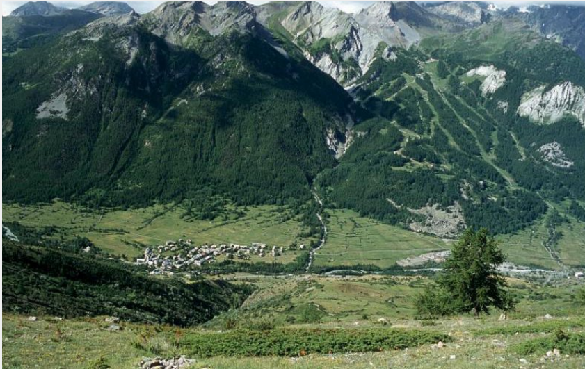
(Vue sur le hameau des Guibertès)