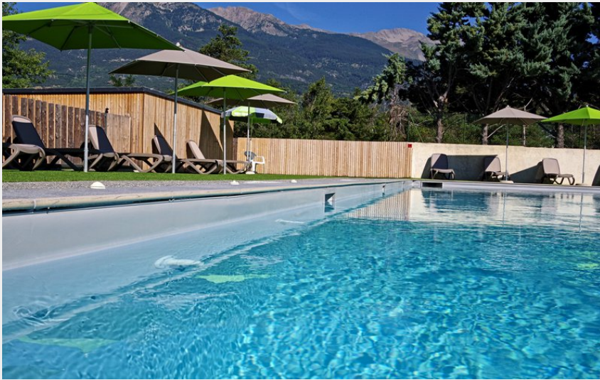
Crédit photo : Espace aquatique - Camping le petit Liou (Camping le petit Liou - BARATIER)