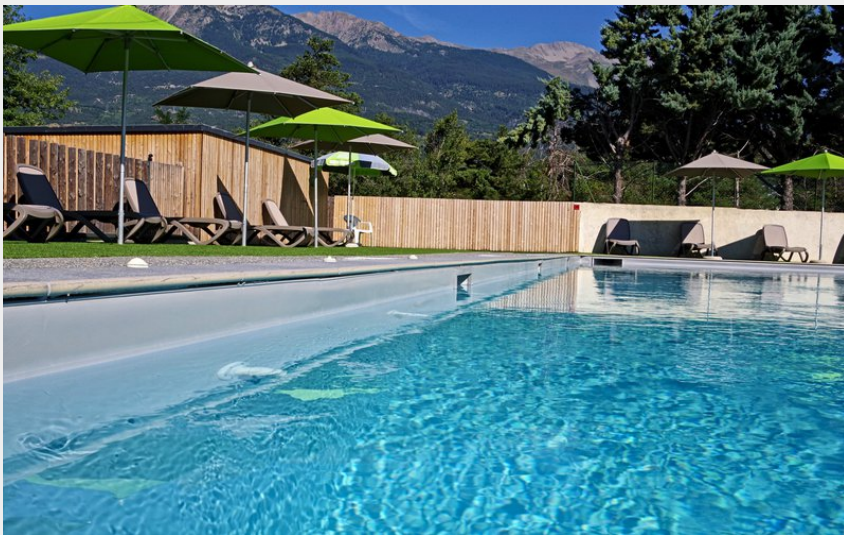
Crédit photo : Espace aquatique - Camping le petit Liou (Camping le petit Liou - BARATIER)