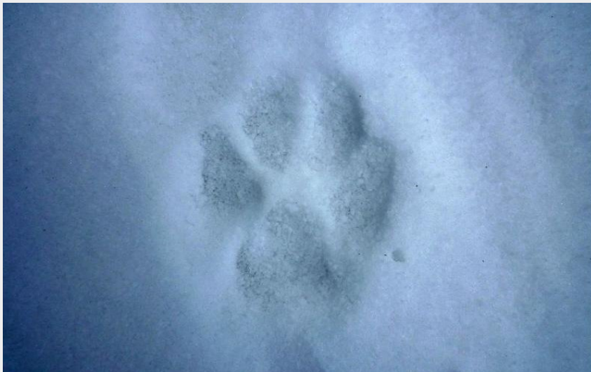
(Empreinte de loup dans la neige)