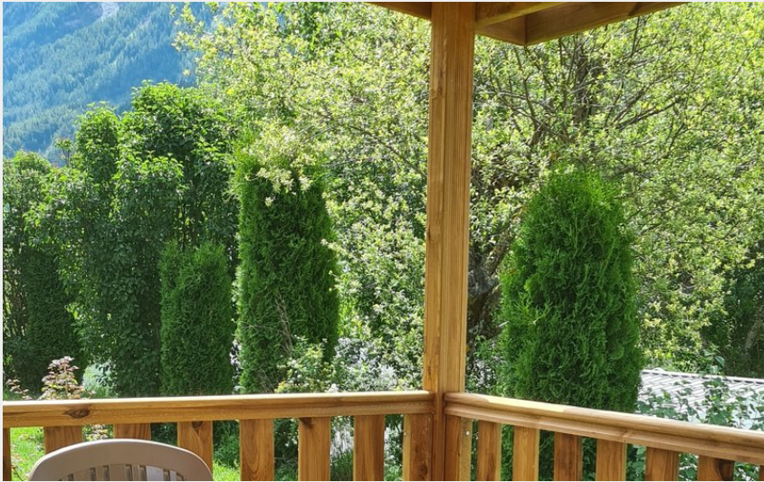
Crédit photo : Camping Les Auches mobilhome à Ancelle, vallée du Champsaur (Les Auches)