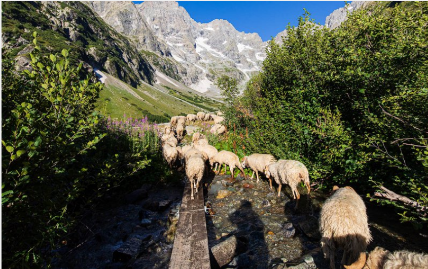
(Montée à l'alpage de Peyre Arguet)