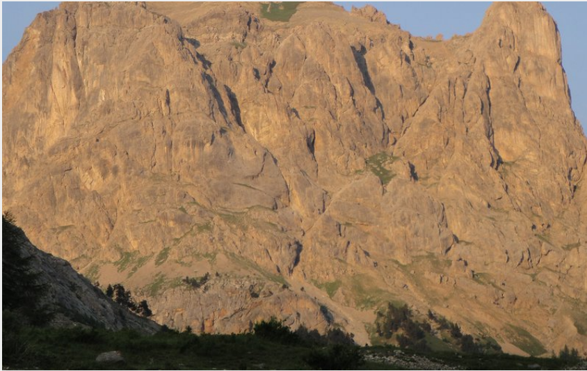
Crédit photo : Alexandre Puech - Horizons (L'aiguillette du Lauzet)