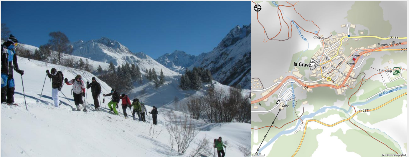
(Montée au Lac du Pontet)