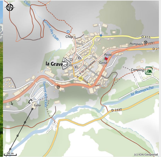
(Balcon de la Guisane - Chemin du Roy)