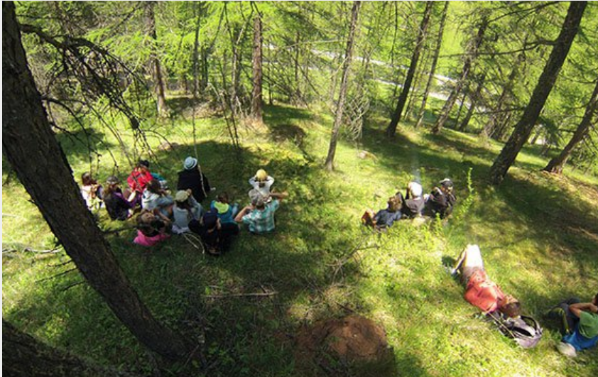
(Ronde des sons en forêt)