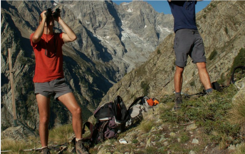
(Observation dans les Ecrins)