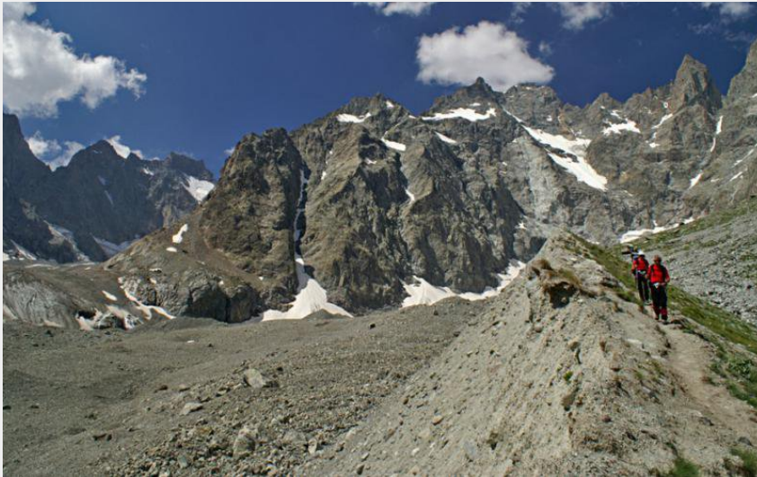
(Le tour de l'Ailefroide et du Pelvoux)