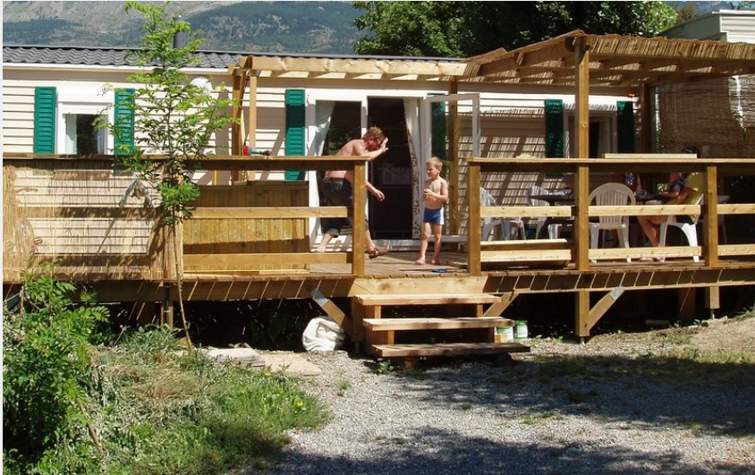
Crédit photo : mobil home standard - Camping Le Serre du Lac (Camping Le Serre du Lac)