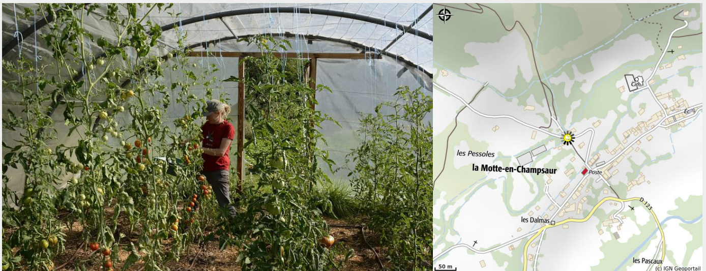
(La serre - La P'tite bête du Champsaur)