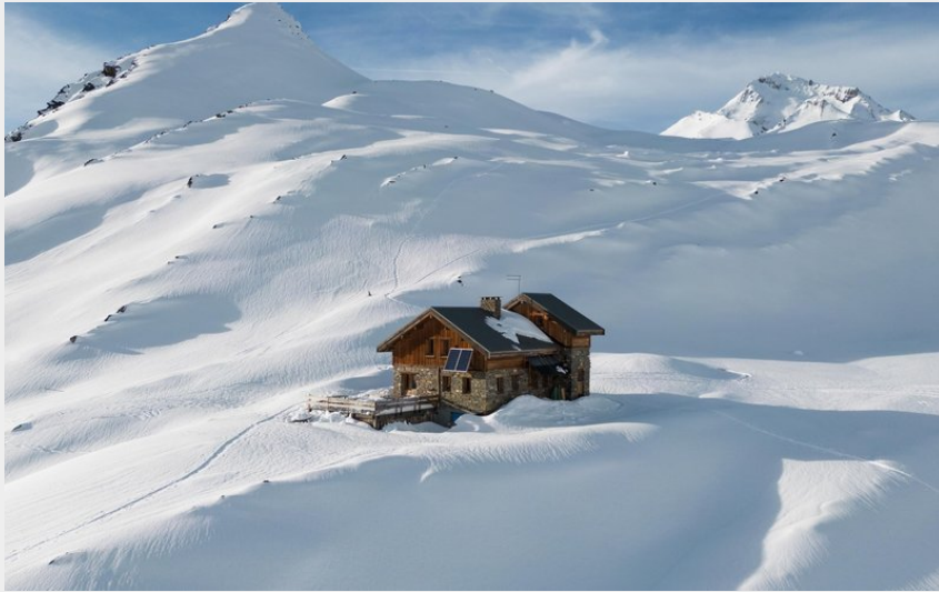
Le refuge du Goléon en hiver