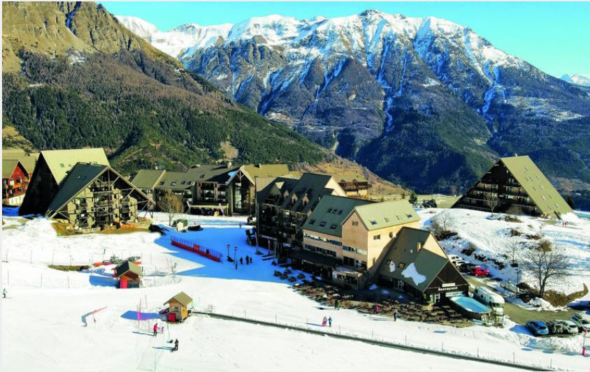
Crédit photo : Hôtel Club Le Balcon des écrins - Réallon (Hôtel Club Le Balcon des écrins)