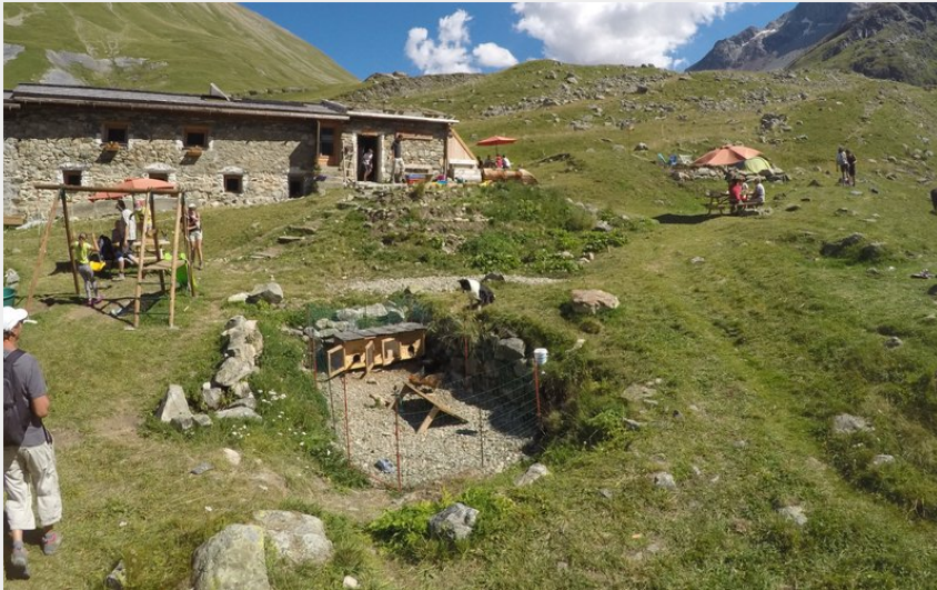
Crédit photo : Le Refuge de Chamoissière - Villar d'Arène - La Grave (©Refuge Chamoissière)