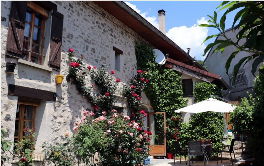
Crédit photo : Chambres d'hôtes Le Cairn, vallée du Champsaur (Le Cairn)