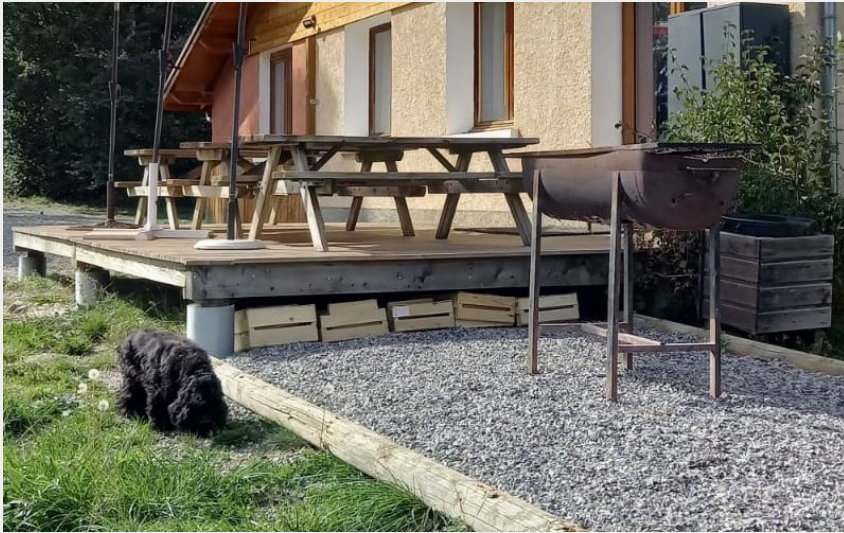
Crédit photo : Gîte de groupe 'La Villa', St Jean St Nicolas, vallée du Champsaur (Pierre Para)